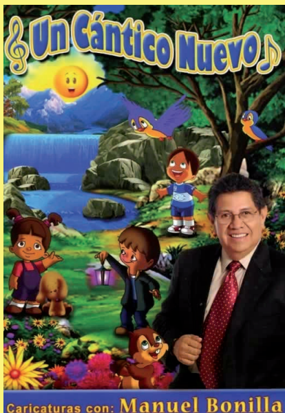
Caricaturas con: Manuel Bonilla

Conoce más te este ministerio, haciendo clic aquí .