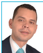
Por Ps. Joan A. Tintinago, Recursos Educativos en Colombia, www.recursos.fecp.co

Dios les dio recursos a los hombres en cada etapa, para que se pudieran comunicar, para que pudieran evangelizar, para que formaran líderes y guiaran a Su pueblo por Su Palabra, para así mostrar que sin Dios nada se puede hacer.